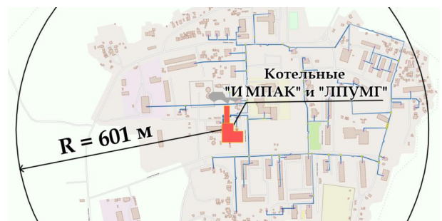
Рисунок 3 – Радиус эффективного теплоснабжения котельных Сорумского ЛПУ МГ и Импак