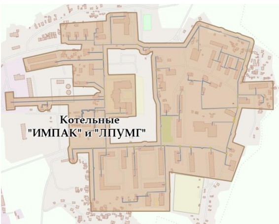
Рисунок 2 – Зона действия источников тепловой энергии

Границы зоны действия источников тепловой энергии на территории с.п. Сорум представлены на рисунке 2.